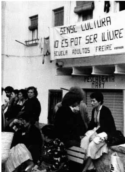
Imatge 1. Pancarta Escola Freire.

Amb el pas del temps, la renovació de l'equip docent en l'Escola Freire i la seva definitiva incorporació en l'organigrama públic educatiu de la Generalitat de Catalunya, van fer que aquesta deixés de ser un dels motors culturals del barri. Part d'aquesta activitat es va traslladar a altres equipaments del barri, ja fora en l'àmbit de la programació, com va succeir amb l'Ateneu Popular 9 Barris, com en el formatiu, com va succeir a través de la Xarxa d'Intercanvi de Coneixements de Nou Barris, situada en el Centre Ton i Guida. No obstant això, el record dels orígens de la «Freire», com és coneguda al barri, segueix viu en el districte de Nou Barris.