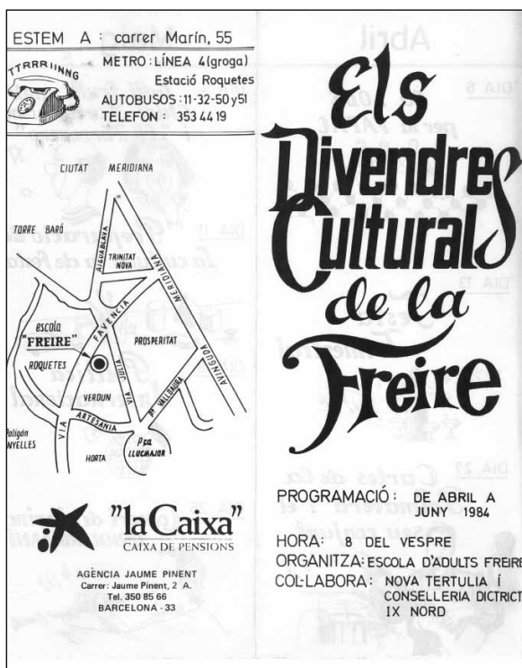
Imatge 3. Divendres de la Freire.